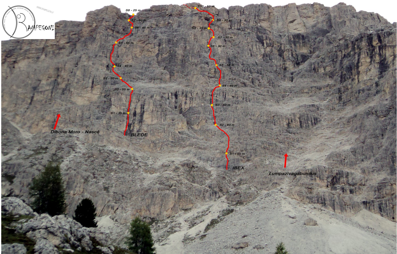
Inquadramento delle vie del Lagazuoi Ovest