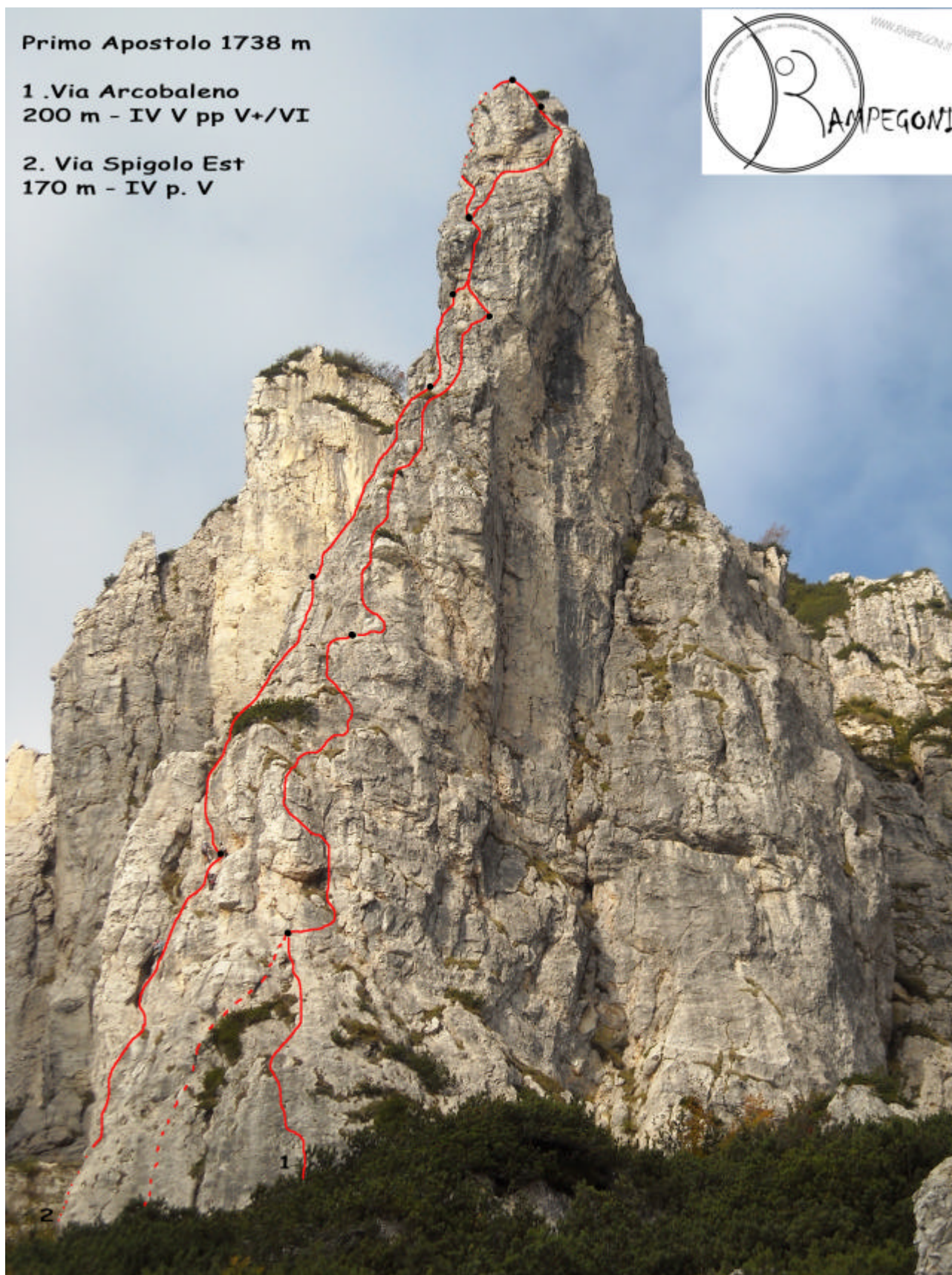
Primo apostolo con tracciati