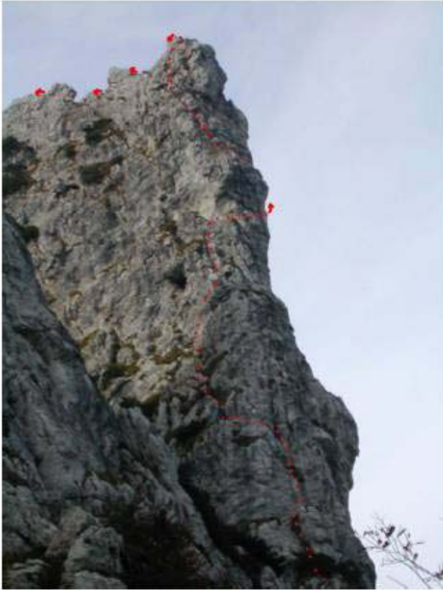
Il tracciato della via Faccio Snichelotto allo spigolo Est del 1° Apostolo